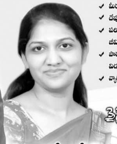
శ్రీమతి బైస్కోపెస్టి గారు